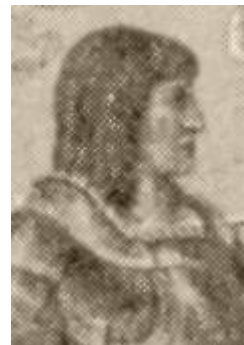
Wilhelm III (IV)

Abb. auf einer Dalmatik [=liturgisches Gewand] des 15. Jh., Lambertuskirche Düsseldorf