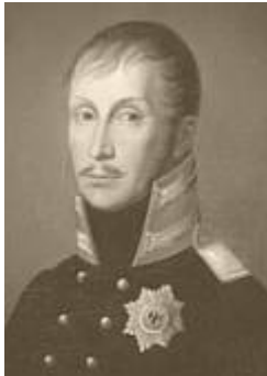
Friedrich Wilhelm III

(1859-1941) König von Preußen, Deutscher Kaiser ..... 1888-1918