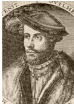
Wilhelm der Reiche