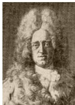
Johann Wilhelm II (Jan Wellem. Sein Reiterstandbild steht vor dem Düsseldorfer Rathaus.)