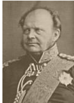
Friedrich Wilhelm IV